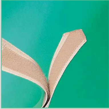
Gurte mit Klettenverschluß

Zum Fertigstellen der Bandage bieten wir an: