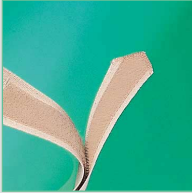
Gurte mit Klettenverschluß

Zum Fertigstellen der Bandage bieten wir an: